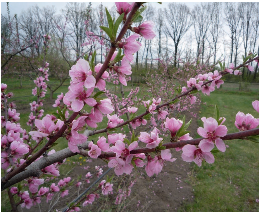
Az őszibarack mélynyugalma már februárban megszűnik

rágrügy megkapta a szükséges melegmennyiséget, akkor kezdődik a virágzás. A fajta, genotípus számára a kivirágzáshoz szükséges melegegységek kiszámítására is sokan tettek kísérletet, és vannak ezzel kapcsolatos kalkulációk. A bizonytalanságot itt is ugyanaz okozza, amit a korábbi fejlődési szakaszban em-