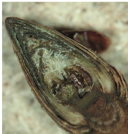
Csak a nagyon erős téli fagy okoz rügykárt a cseresznyében

vény számára, nem játszódnak le szabályosan az élettani folyamatok. Itt tehát a rendszeres talaj- és levélvizsgálatra alapozott, optimális mennyiségeket kijuttató tápanyagpótlásnak van nagy jelentősége. A mikroelemek pótlására is fi-