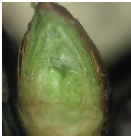
A teelő cseresznyerügyben kialakultak a virágszervek kezdeményei

A virágrügyfejlődés első szakasza az előnyugalom, ami az őszi lombhullásig tart, ilyenkor nagyon megnő a gyümölcsfák víz- és tápanyagigénye. A hazai éghajlati viszonyok között ebben az időszakban gyakran