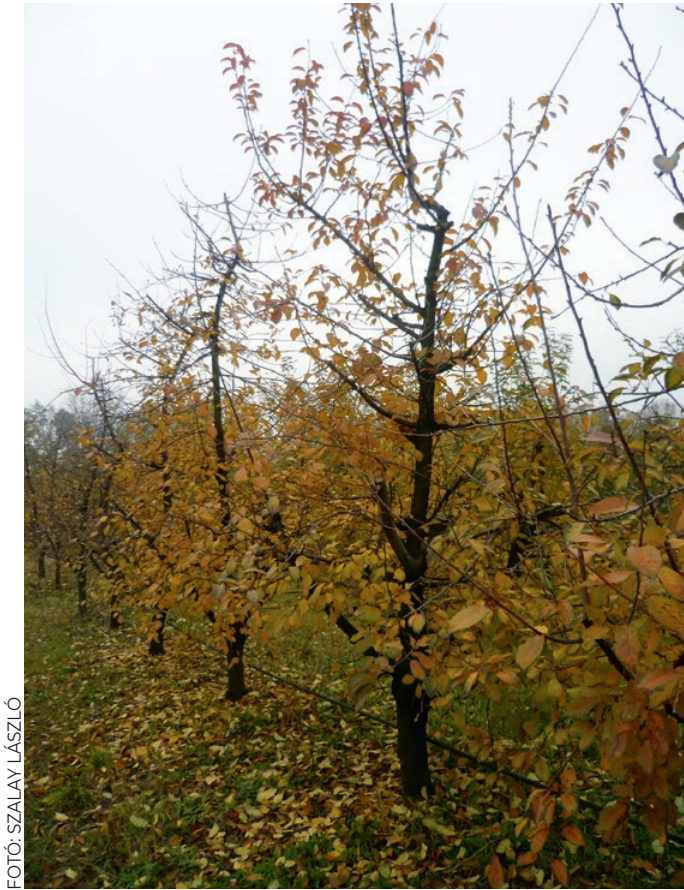
FOTÓ: SZALAY LÁSZLÓ

Ha minden rendben ment, a virágrügyekben az őszi lombhullásig minden virágszerv kezdeménye kialakul