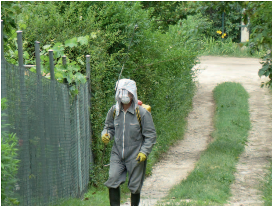
Munkavédelem? Elsősegélynyújtási ismeretek?

információk. Az egyéni gazdaságokban sem lehet jobb a helyzet. A KSH szerint „A gazdaságok 60 százaléka kizárólag saját fogyasztásra termel. A kizárólag saját fogyasztásra termelő gazdálkodók 92 százaléknak nincs semmilyen mezőgazdasági végzettsége, leginkább gyakorlati tapasztalataikra hagyatkoznak.”