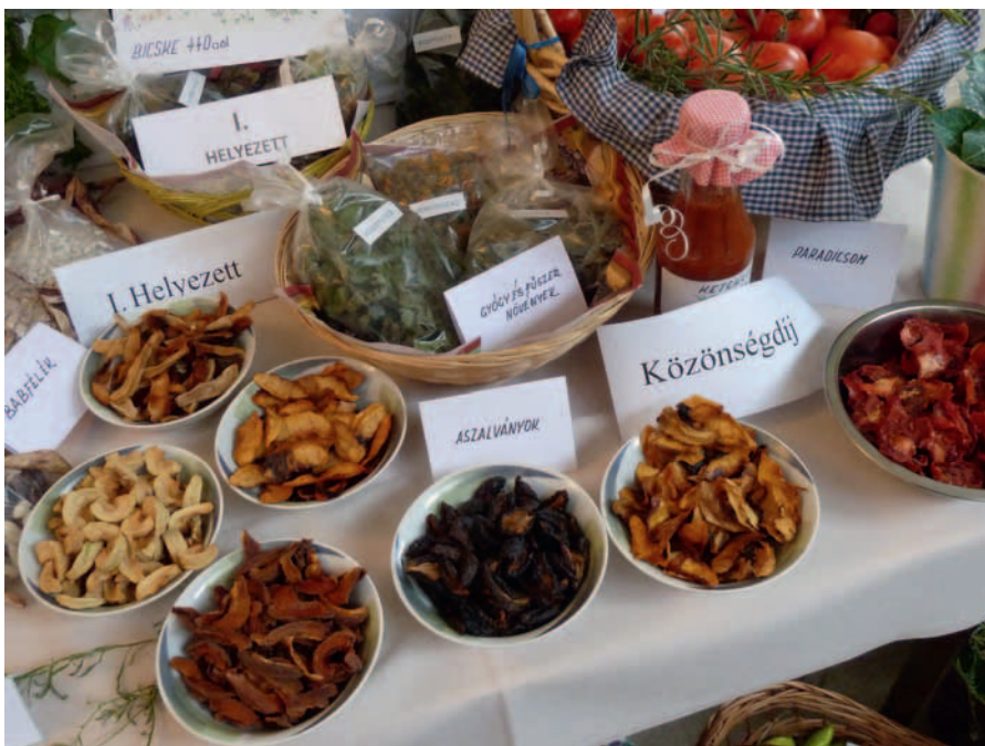
Különlegességek, hungarikumok a „Honvéd Kertbarát Kör” tavalyi kiállításáról

A fejezetcímek megegyeznek Rachel Carson „Néma tavasz” című könyvének fejezetcímeivel.