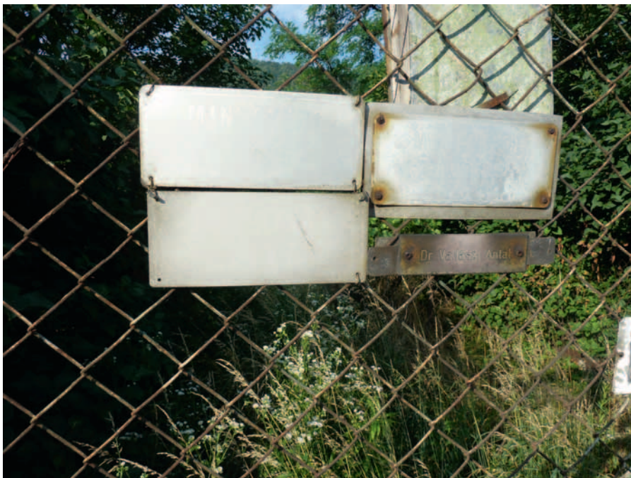
Napszitta mintakert táblák, gyomos elhanyagolt kert

nyári munkanapot vett igénybe kerületenként a bejárás. Mindenkinek tanulságos volt ez a néhány nap. A házigazdák a legújabb technológiákról, fajtákról hallhattak tőlünk, mi a növények egészségi állapotáról, a gazdák felkészültségéről kaptunk egy teljes körképet. Talán 1988-ban osztottuk ki az utolsó mintakert táblát.