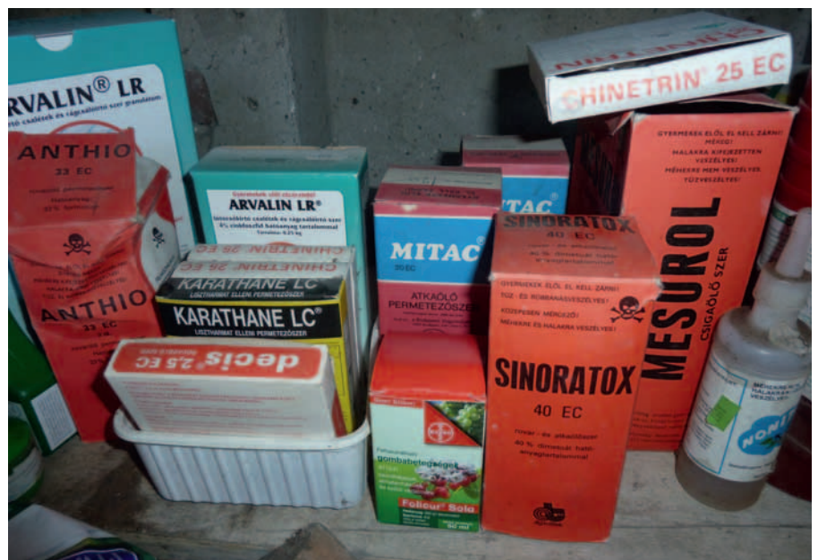
Vegyszerraktár a sufniban

A családi házaknál, a hétfégi telkeken kertészkedőkhöz jelenleg alig jutnak el a friss növényvédelmi