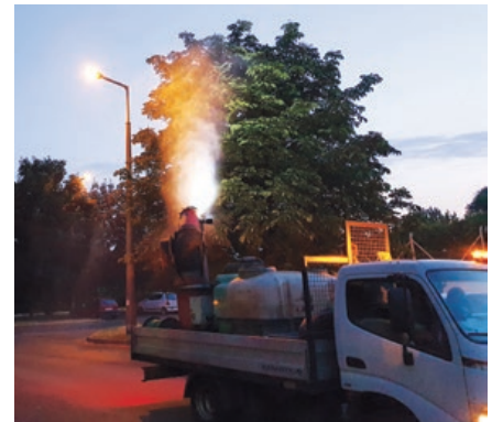
Tökéletes a porlasztás és a permetléfedés a Növényvédő és Kártevőirtó Kft. kommunális permetezőgépevel

is tudnia kell annak, akit például a levél-tetves akácok, juharok vagy szivarfák ke-zelésével bíznanak meg. Mit szabad el-vállalni? Gutermuth Ádám táblázata segít a válaszadásban. A kísérlete során túl-nyomásos injektálással 24 nemzetség 32 faját vizsgálták meg. Összehasonlítási alapul az öt milliliter víz fába préselésé-hez szükséges időtartamot mérték meg.