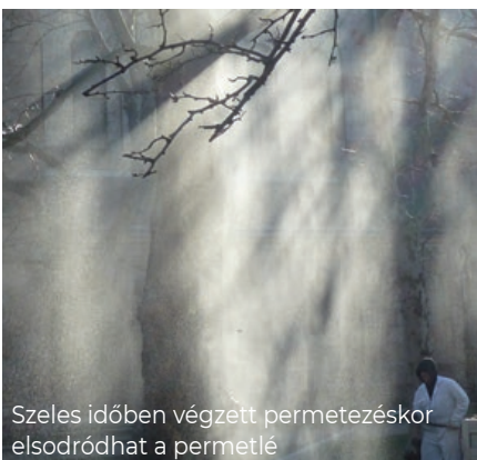
Szeles időben végzett permetezéskor elsodródhat a permetlé

• Összesen két, szükséghelyzeti engedéllyel rendelkező rovarölő és gombaölő szer használható. Az utóbbi hatása három évig is tarthat, erre garanciát vállalnak az injektálók. A legnagyobb gondot