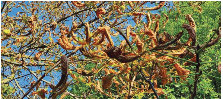
Kezeletlen vadgesztenyefa július 20-án