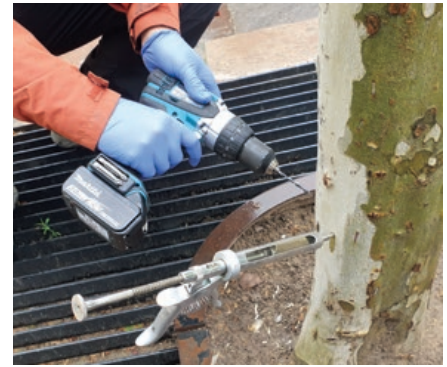
A kis átmérőjű és speciális hegyű fúrószár kisebb sebet ejt a fán. A tipli nélküli injektáló gép munka közben

Ezeket a kérdéseket meg kell oldani! A minősített favizsgáló végzettség mintájá-ra érdemes lenne engedélyhez kötni az injektálási munkát is. Lenne mit tanítani, mert például a fúrószár átmérőjének, a fúrások közötti fertőtlenítésnek, a kéreg-pikkelyek eltávolításának, továbbá az in-jektáló műszer típusának és helyes hasz-nálatának is döntő szerepe van abban, hogy a fát meg tudják védeni és a sebek is begyógyuljanak. Lassan az is tisztázódik, hogy milyen fafajokat lehet injektálni. Ezt