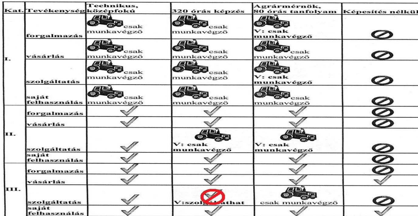
Engedéllyel végzett tevékenységek képesítés szerint